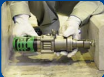
▶ 狭い場所でも施工可能