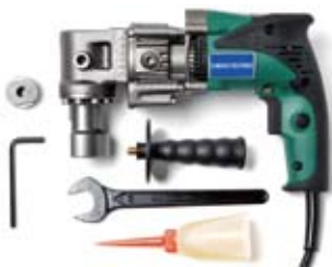
SD-270C-LH L型ヘッド/コード付 軽量タイプ 標準価格 130,000円 (税別)

適用範囲：オールアンカー C・SC・C-D M6～M20、W30、W40、M8D～M20D 電源：ニッケル水素電池 DC14.4V 容量 3.0Ah 施工時間：約 6秒 ※1 外形寸法：(L)325×(W)90×(H)245mm 質量：4.2kg (蓄電池含む)