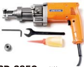
SD-385C コード付 標準価格 125,000円 (税別)

適用範囲：オールアンカー C・SC・C-D M6～M10、W30、M8D、M10D 電源・電流：単相交流 100V 50/60Hz 10.2A ※1 施工時間：約 2秒 ※2 外形寸法：(L)301×(W)80×(H)188mm 質量：3.0kg