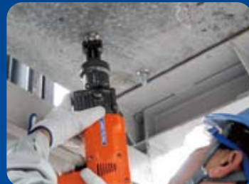
▶ 天井もらくらく施工