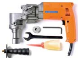
SD-333C-LH L型ヘッド/コード付 標準価格 135,000円 (税別)

適用範囲：オールアンカー C・SC・C-D M6～M10、W30、M8D、M10D 電源・電流：単相交流 100V 50/60Hz 10.2A ※1 施工時間：約 2秒 ※2 外形寸法：(L)270×(W)80×(H)182mm 質量：3.5kg