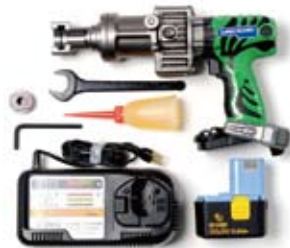
SD-325CL コードレス 標準価格 196,000円 (税別)

適用範囲：オールアンカー C・SC・C-D M6～M20、W30、W40、M8D～M20D 電源・電流：単相交流 100V 50/60Hz 10.2A ※1 施工時間：約 3秒 ※1 外形寸法：(L)385×(W)92×(H)198mm 質量：4.5kg