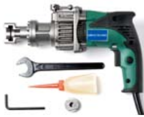
SD-305C コード付 軽量タイプ 標準価格 120,000円 (税別)

適用範囲：オールアンカー C・SC・C-D M6～M10、W30、M8D、M10D 電源・電流：単相交流 100V 50/60Hz 10.2A ※1 施工時間：約 2秒 ※2 外形寸法：(L)301×(W)80×(H)188mm 質量：3.0kg